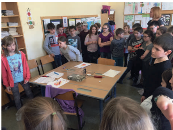
Experimente mit Feuer ↑