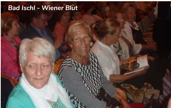
Bad Ischl - Wiener Blut