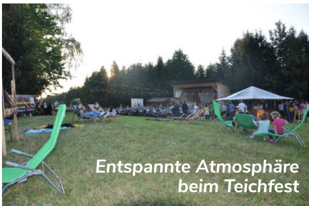
Entspannte Atmosphäre beim Teichfest