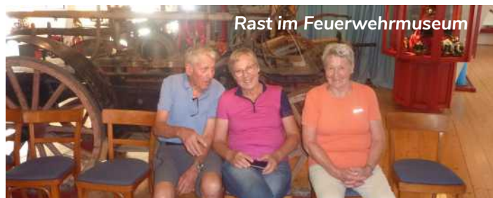
Rast im Feuerwehrmuseum

Das „Hand Werk Haus“ und die „Senferei Annamax“ waren Ziel unseres Ausfluges in das Salzkammergut nach Bad Goisern. Handwerk als kulturelles Erbe, gelebte Tradition und Zukunftsvision ist in der Ausstellung erlebbar. Über süße, pikante und scharfe Senfe, hergestellt aus erlesenen Grundstoffen und Zutaten in schonender Verarbeitung, wurden wir in der Schausenferei „Annamax“ informiert und konnten diese auch gleich mit Weißwürsten und frischem Senf verkosten. Den Nachmittag füllte eine gemütliche Schifffahrt auf dem Traunsee von Gmunden nach Ebensee und wieder zurück. Kaffee und Kuchen wurde serviert. Vom Schiff aus genossen wir herrliche Ausblicke auf das sommerliche Treiben am Seeufer.