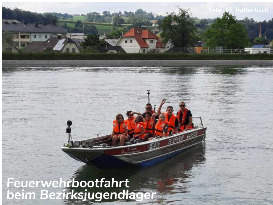
Feuerwehrbootfahrt beim Bezirksjugendlager