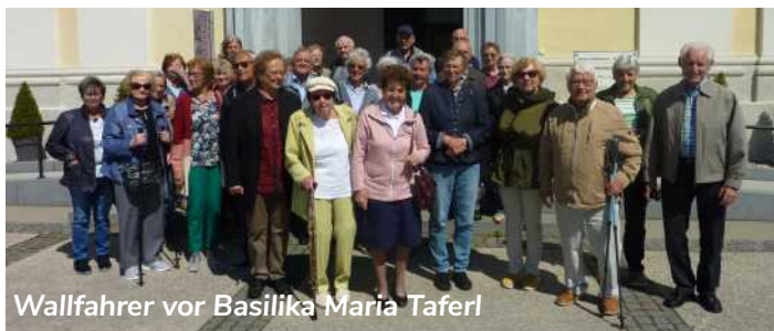
Wallfahrer vor Basilika Maria Taferl

Bachl war der Abschluss des Tages vor Rückfahrt nach Ternberg.