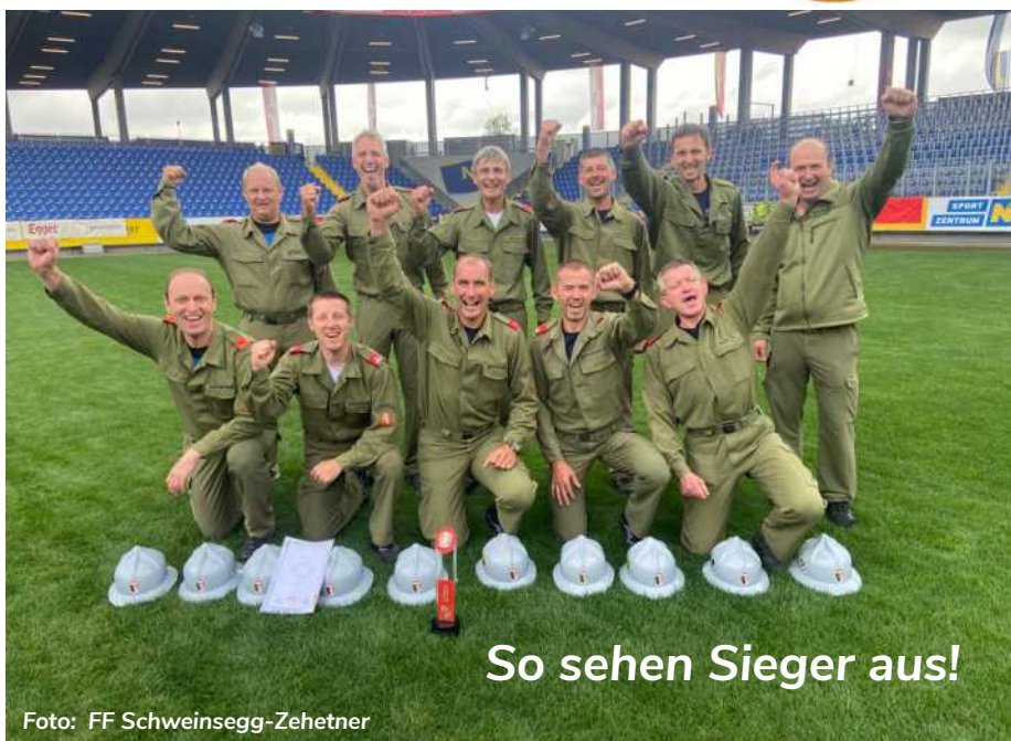
So sehen Sieger aus!