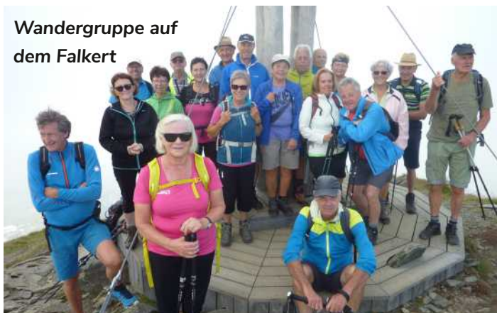
Wandergroupe auf dem Falkert

An der diesjährigen Wanderwoche in Bad Kleinkirchheim nahmen 47 Wanderer teil. Das Hotel Kärntnerhof war für unsere Reisegruppe gebucht. Die Anreise erfolgte über das Maltatal, wo die Kölnbrein Staumauer besichtigt und Mittageseinkehr gemacht wurde. Die vielfältigen Wandermöglichkeiten Bad Kleinkirchheims – Falkert und Falkertsee, Nockberge von St. Oswald aus, Kaiserburg vormittags und Schifffahrt auf dem Millstätter See nachmittags, Wanderungen von der Nockalmstraße ausgehend und im Bereich der Turracher Höhe – waren das Wochenprogramm.