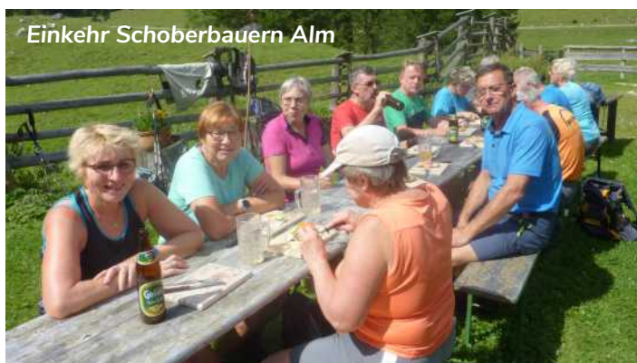
Einkehr Schoberbauern Alm

Die „Wochenwanderungen“ finden jeden Donnerstag statt. Treffpunkt ist immer um 09:00 Uhr am Bahnhof Ternberg. Ansprechpersonen sind Alois Buchberger – Tel. 0676 3651 898 bzw. 07256 8617 und jetzt neu Norbert Hametner – Tel. 07256 8051 bzw. 0664 7354 7102 .