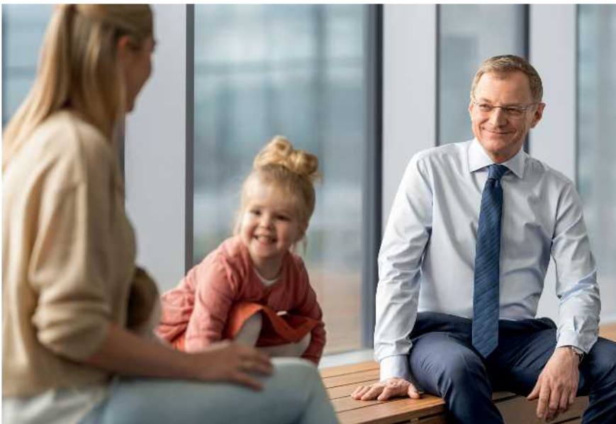
Familien werden mit den Entlastungspaketen besonders unterstützt.

Die steigenden Preise werden zu einer immer größeren Belastung für viele. Insbesondere Familien fällt es immer schwerer, die steigenden Lebenshaltungskosten zu bewältigen.